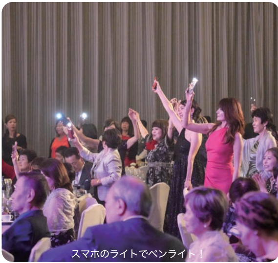
スマホのライトでペンライト！