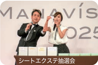
シートエクステ抽選会

そして最後は、本日最大のサプライズで登場した、テツandトモのお二人による圧倒的なパフォーマンス。広い会場を縦横無尽に駆け回り、観客全員を巻き込んだパフォーマンスで会場は一体となって盛り上がりました。こうして、今年もマナビスらしくTHE MANAVIS FESTIVAL 2025は、思い出に残るような、笑顔あふれる素敵な雰囲気の中での閉会となりました。