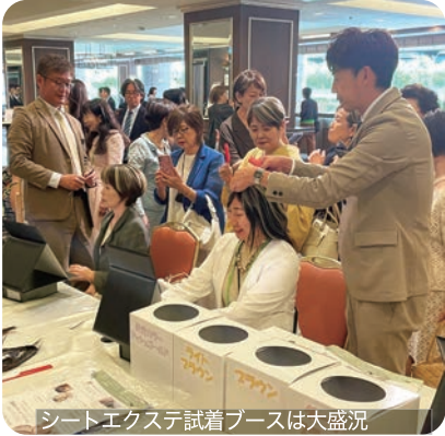
シートエクステ試着ブースは大盛況

■さあ、盛大なパーティの始まりです 楽しい中にも学びがあった第一部とはガラッと変わって、第二部の懇親会では、ご参加の皆様が思い思いにドレスアップを楽しみ、とても華やかな雰囲気の中でパーティーが始まりました。