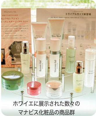
ハワイエに展示された数々のマナビス化粧品の商品群