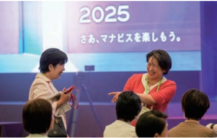
第一部の開始前から会場内至るところで和気あいあいと盛り上がる会員の皆様。