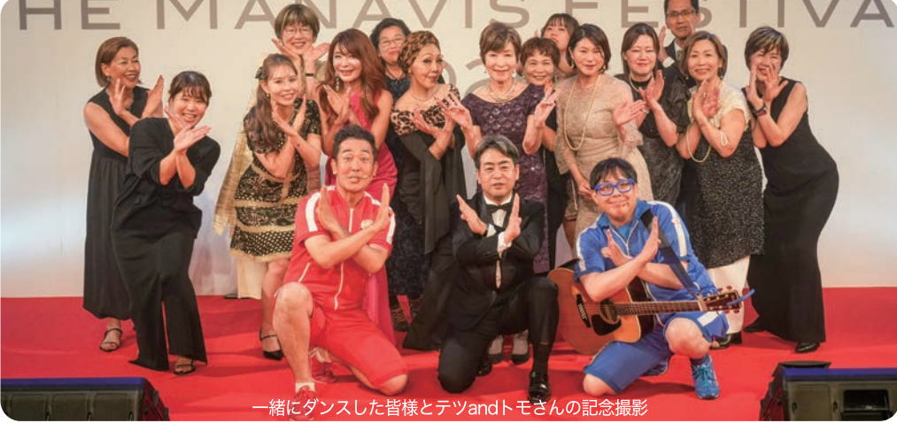
一緒にダンスした皆様とテツandトモさんの記念撮影