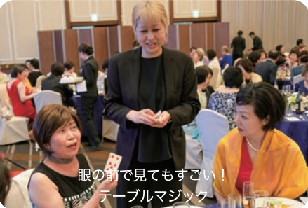
眼の前で見てもすごい！テーブルマジック