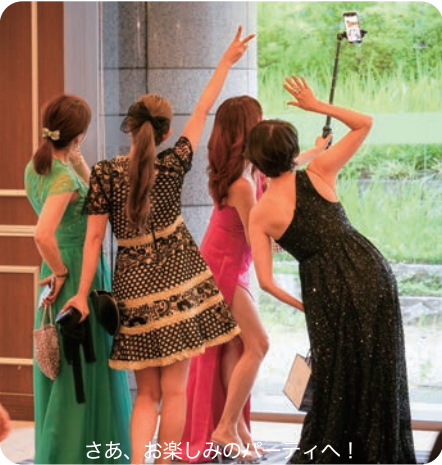
さあ、お楽しみのパーティへ！