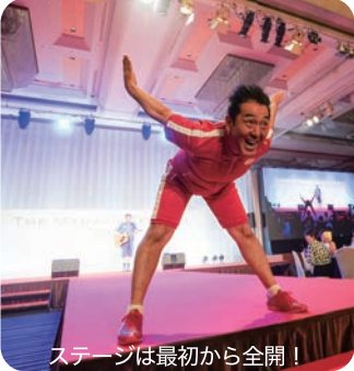
ステージは最初から全開！