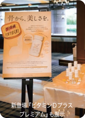
新登場『ビタミンDプラスプレミアム』も展示