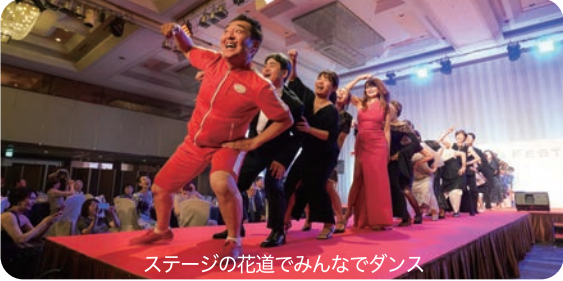
ステージの花道でみんなでダンス