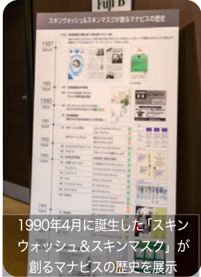
1990年4月に誕生した「スキンウォッシュ&スキンマスク」が創るマナビスの歴史を展示