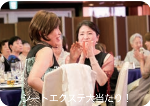
シートエクステ大当たり！