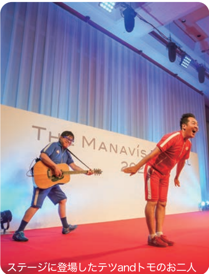
ステージに登場したテツandトモのお二人