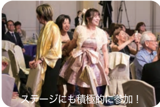
ステージにも積極的に参加！