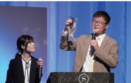
ウィッグ事業課からはシートエクステの期間限定色「アッシュゴールド」を発表。