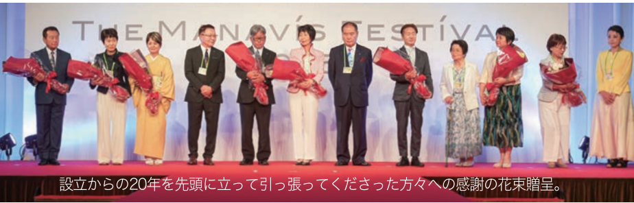
設立からの20年を先頭に立って引っ張ってくださった方々への感謝の花束贈呈。

THE MANAVIS FESTIVAL 2025第一部は、楽しい中にも学びがある場となって終了しました。この後は、お色直しをして、お楽しみの第二部の懇親会へと、まだまだTHE MANAVIS FESTIVALは続きます。詳細は折込みの中面ページで！