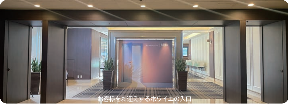
お客様をお迎えるハワイエの入口