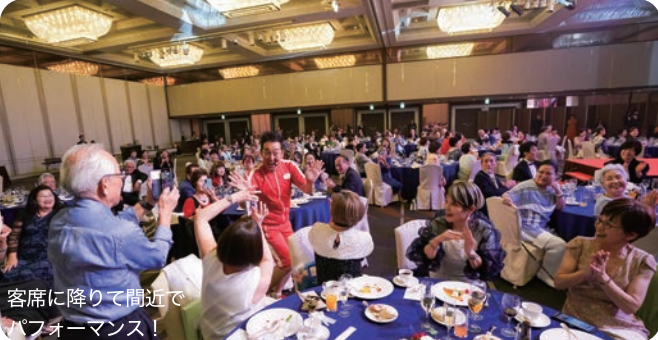
客席に降りて間近でパフォーマンス！